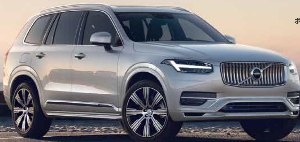
XC90 Recharge Plug-in hybrid T8 AWD Inscription

本当の贅沢とは、何か。 人生と真剣に向き合って生きてきたあなたには、それがわかっている。 家族や、大切な人と過ごすかけがえのない時間を、 心から楽しむことが、本当の贅沢であることを。 ボルボの最上級 SUV XC90。堂々の佇まいに漂う品格と上質な仕立て。 そのすべては、あなたの贅沢な時間のためにしつらえたもの。 環境に配慮したプラグインハイブリッドのスムーズな走り。 搭載バッテリー容量は大型化され、 排出ガスを発生しないEVモードでの航続距離も大幅に伸長。 あなたと、乗る人すべてを笑顔にする、ボルボ XC90 とともに、 さあ、人生の、新しいページへ。 ボルボ、それはあなたを語るもの。