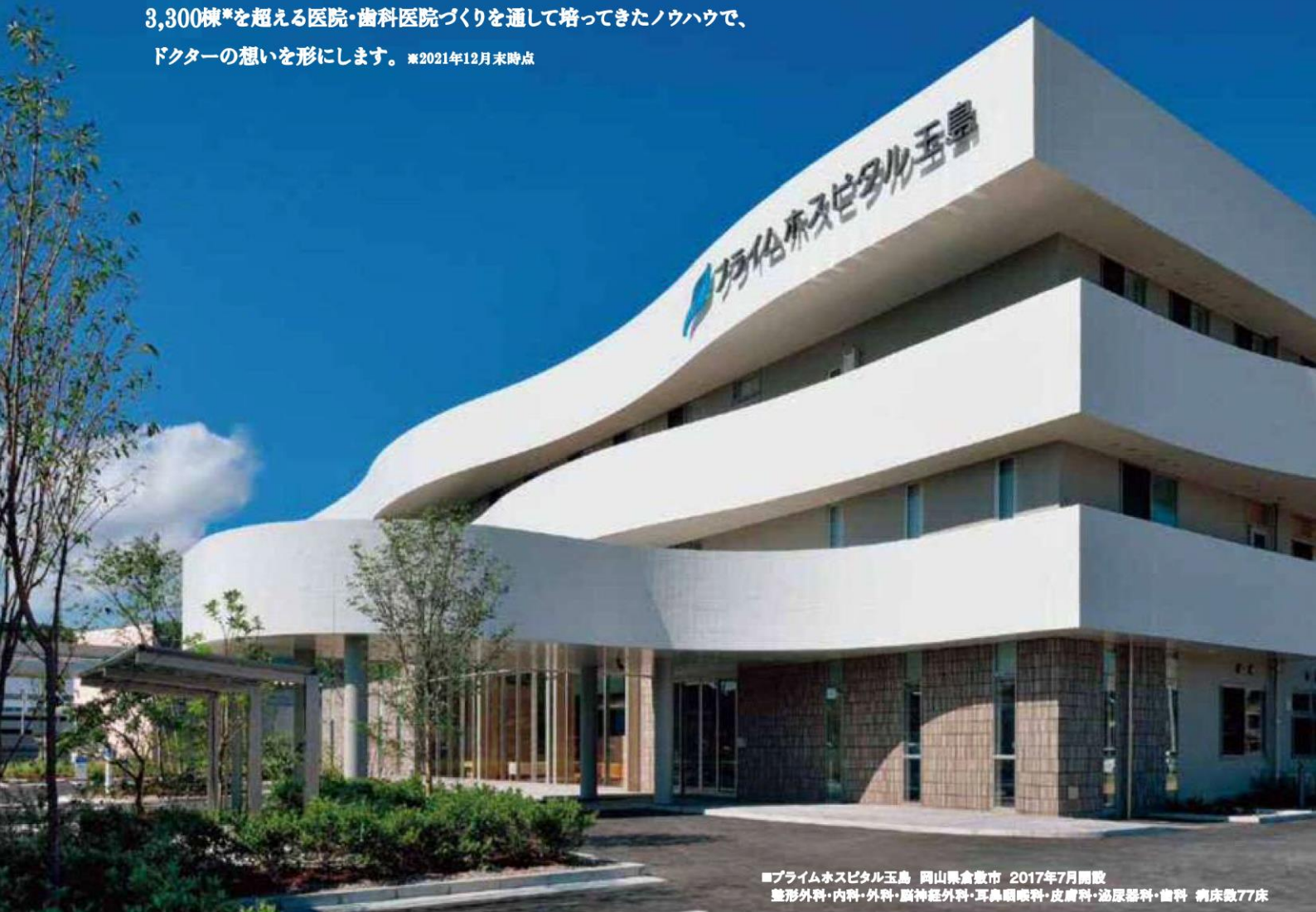
■プライムホスピタル玉島 岡山県倉敷市 2017年7月開設 整形外科・内科・外科・脳神経外科・耳鼻咽喉科・皮膚科・泌尿器科・歯科 病床数77床

3,300棟*を超える医院・歯科医院づくりを通して培ってきたノウハウで、 ドクターの想いを形にします。 ※2021年12月末時点